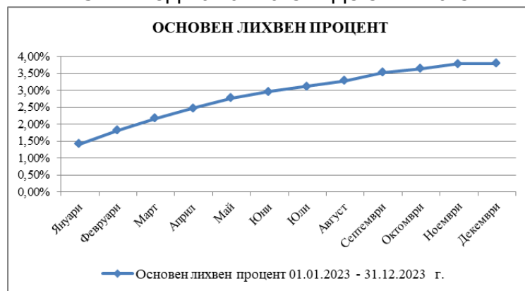
ОСНОВЕН ЛИХВЕН ПРОЦЕНТ НА БНБ ПРЕЗ ПЕРИОДА 01.01.2023 Г. ДО 31.12.2023 Г.

По данни на БНБ от 29 декември 2023 г. основният лихвен процент (ОЛП) през ноември 2023 г. е 3.79%, като в сравнение с октомври 2023 г. се увеличава с 0.15 процентни пункта (пр. п.).